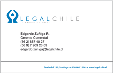
Tarjeta de visita